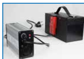
Mehrspanniges, belüf- tetes Batterieladegerät