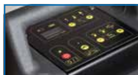
Armaturenbrett mit intuitiven Tasten