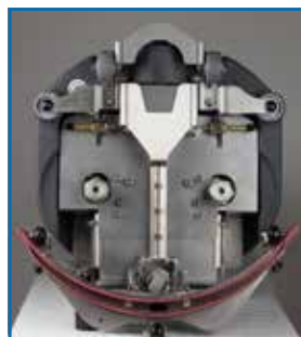
Bürstkopf aus Edelstahl