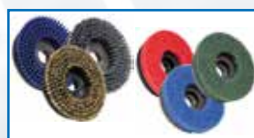
Schrubbürsten und Pads