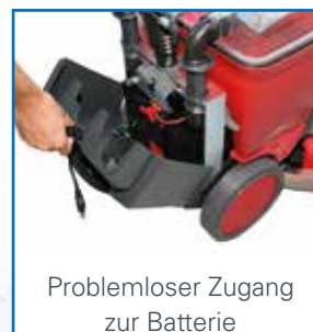
Problemloser Zugang zur Batterie