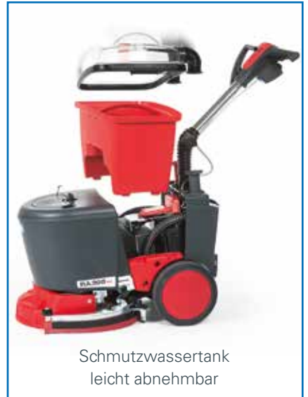
Schmutzwassertank leicht abnehmbar