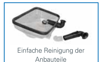
Einfache Reinigung der Anbauteile