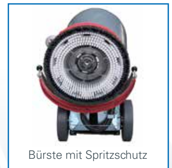
Bürste mit Spritzschutz