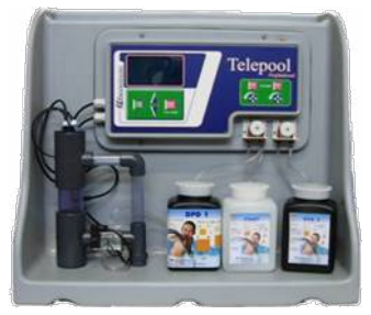
Ein optimales Ergebnis ist bei der Kombination mit den Steuergeräten der Serie „Telepool“ gewährleistet.