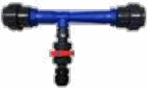
Venturi-Einheit hydraulisches Absaugsystem