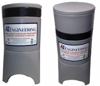
DDS Evolution DDS Evolution plus