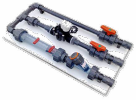
Magnetventil-Tafel zur Kontrolle des Wasserstroms