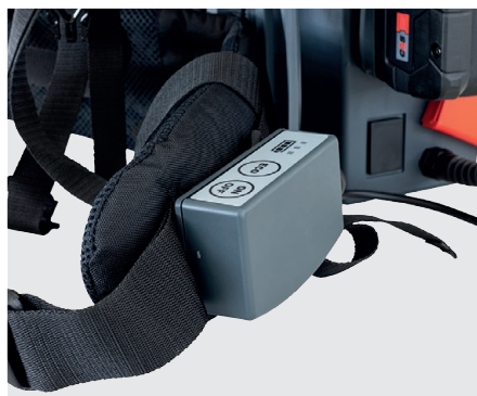
Unité de commande sur la bretelle