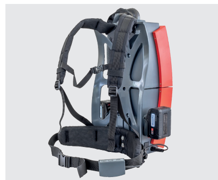
Cadre de transport ergonomique