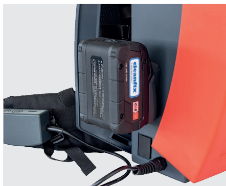
Logement de la batterie sur le côté de l'aspirateur