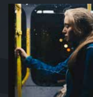
TRANSPORTS EN COMMUN