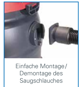
Einfache Montage/ Demontage des Saugschlauches