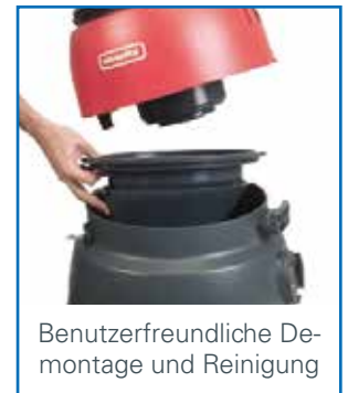
Benutzerfreundliche Demontage und Reinigung