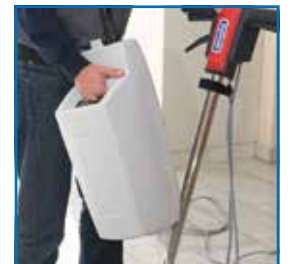
Einfache Montage und Demontage des Laugentanks (optional)