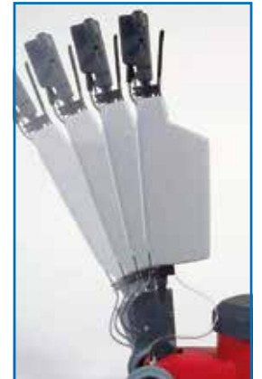
Stufenlose Stielverstellung, optional mit Laugentank