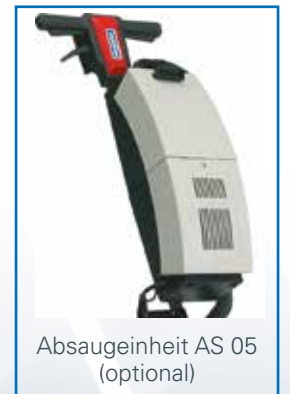
Absaugereinheit AS 05 (optional)