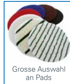
Grosse Auswahl an Pads